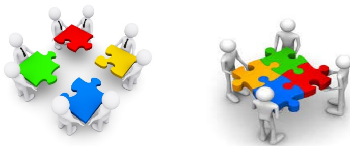
Slika 2: Vsota uspeha

Sodelovanje + timsko delo + zaupanje + sprejemanje + soustvarjanje + predanost = USPEHE