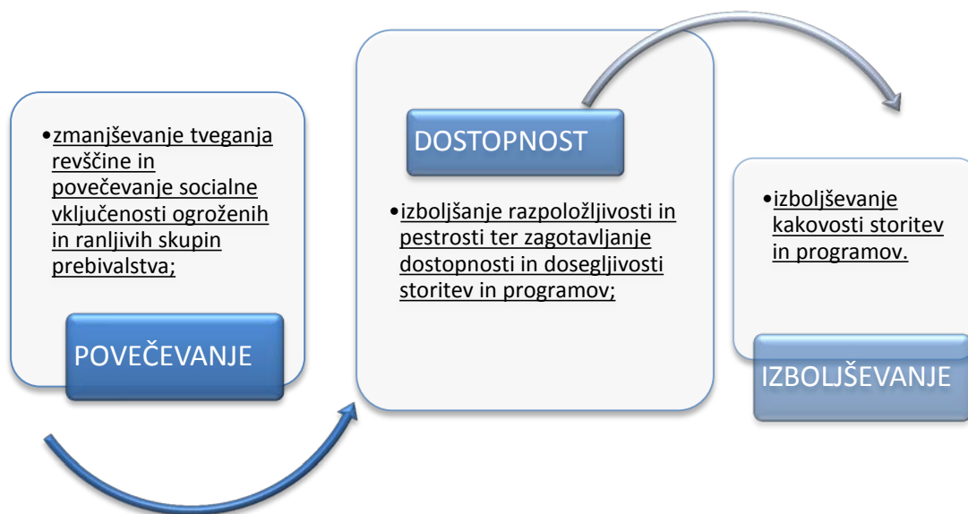
Slika 1: Program Centra za socialno delo Ljubljana

Tudi v bodoče bomo spremljali potrebe občanov z namenom, da v skladu z zastavljenimi cilji povečamo možnost socialne vključenosti ranljivih skupin in zagotovimo pestrost, dostopnost ter dosegljivost programov, ki jih v lokalni skupnosti potrebujemo.