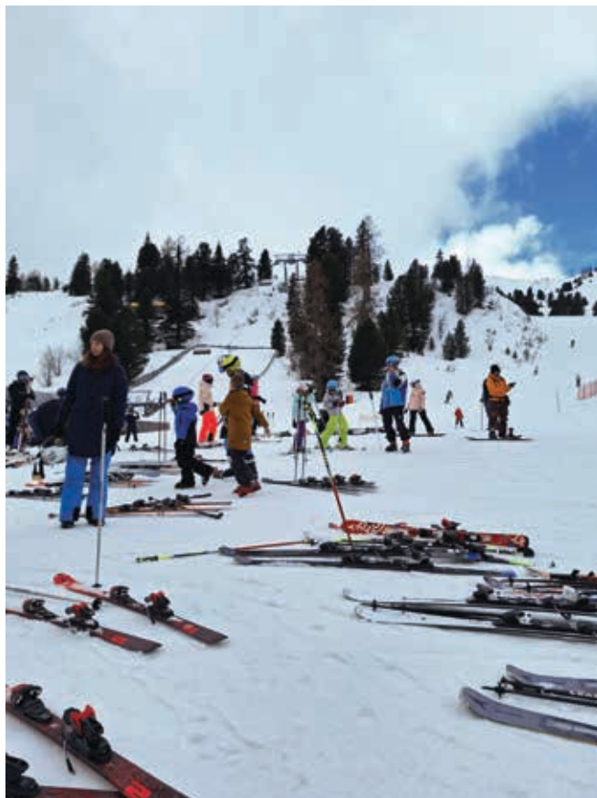
Smučiči po intenzivni smuki postanejo pretežke

V soboto, 2. marca 2024 se je poln avtobus članov OOO Vrhnika odpravil na smučanje v Avstrijo, na smučišče Turracher Hohe. Uživali smo v odlični smuki in lepem vremenu, zvečer pa se ustavili na večerji v gostilni Marinšek v Naklem. Zagotovo ponovimo naslednje leto!